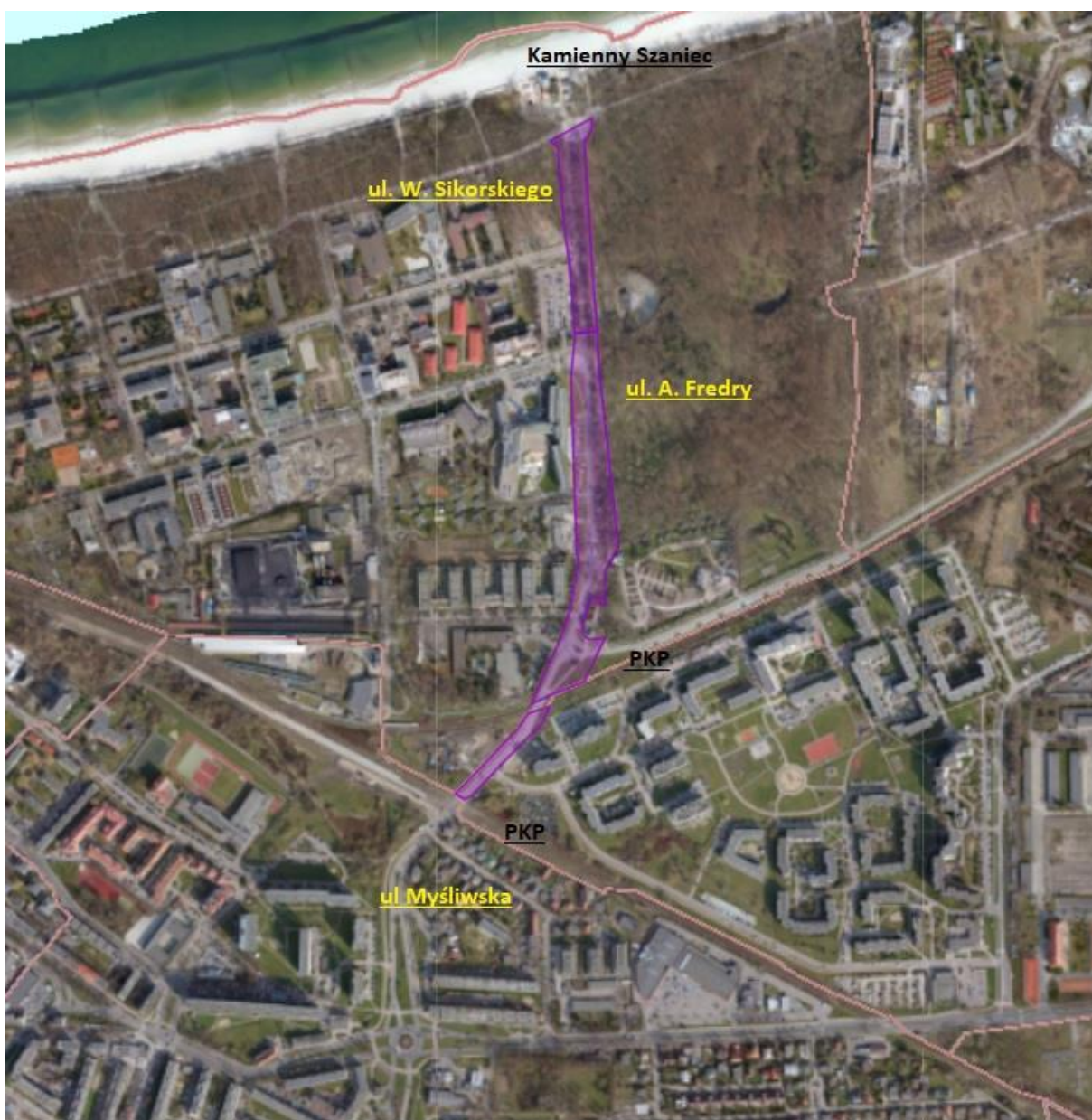
Przebieg ul. Fredry – od Ul. Myśliwskiej do ul. W. Sikorskiego