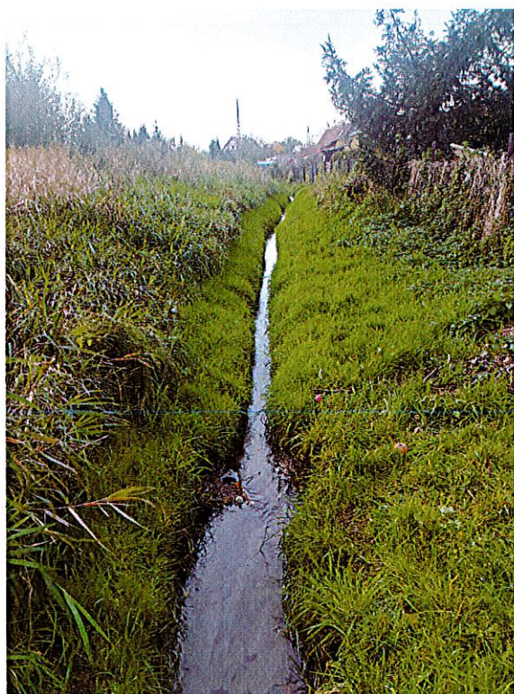
Zdj. nr 3 – stan rowów, wizja z dnia 22.10.2021 r.