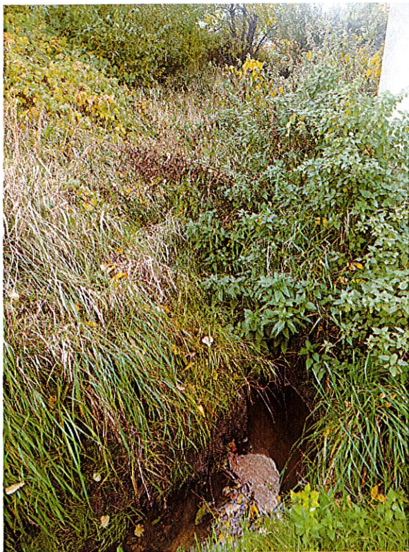
Zdj. Nr 4 – rów poza granicami miasta Kołobrzeg, stan na dzień 20.10.2021 r.