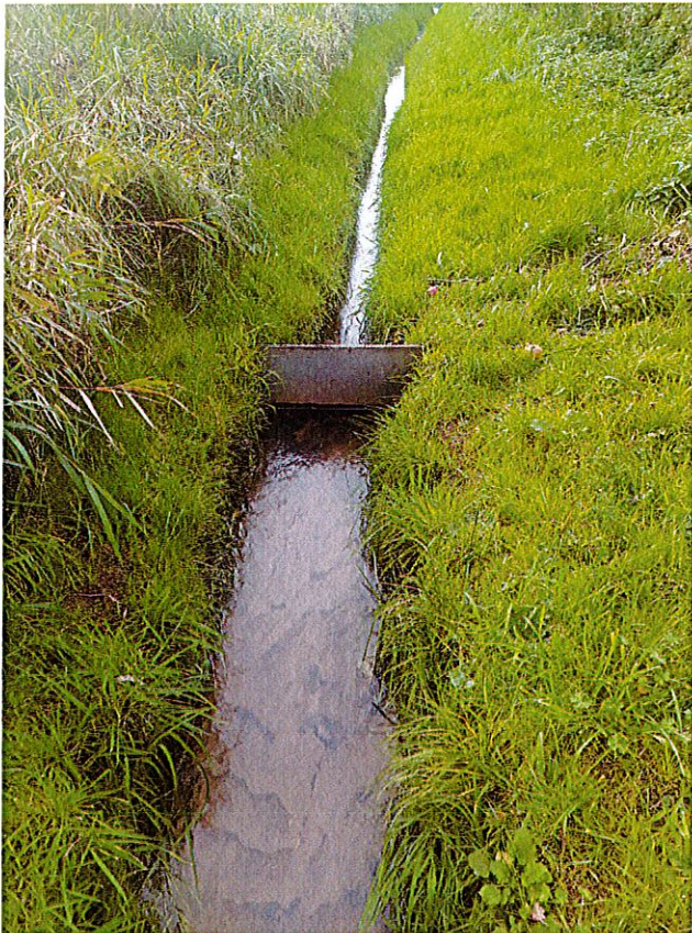
Zdj. nr 1 – zapora na rowie