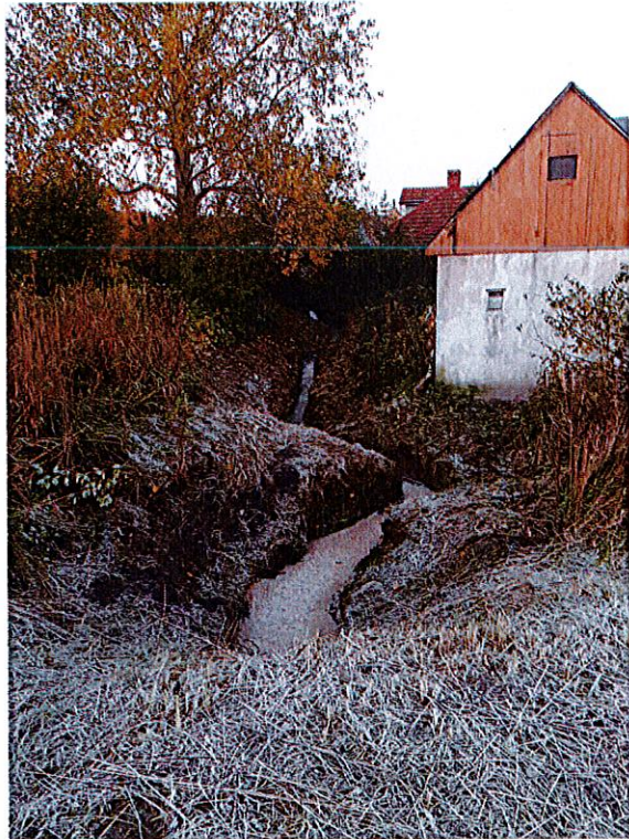
Zdj. Nr 5 – rów poza granicami miasta Kołobrzeg, stan na dzień 23.10.2021r.